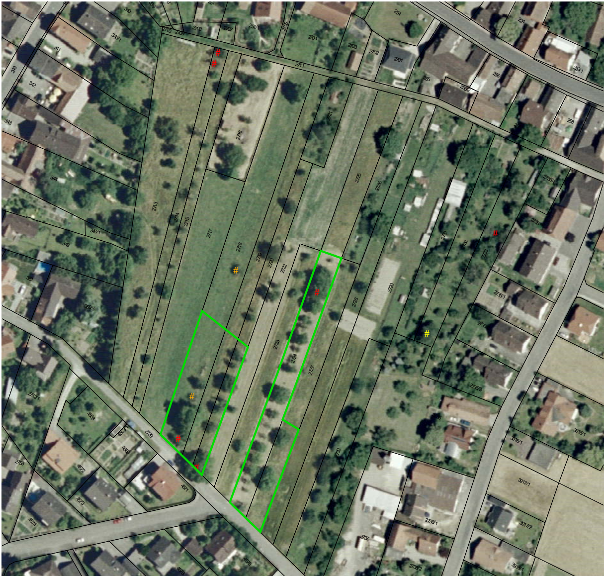
Abb. 2: Körnerbock im Untersuchungsgebiet

Rot markiert sind Bäume mit deutlichen Bohrlöchern der Art, weitere Bäume mit ausschließlich sehr alten Bohrlöchern (orange) und eventuellen Bohrlöchern (gelb) sind ebenfalls dargestellt.